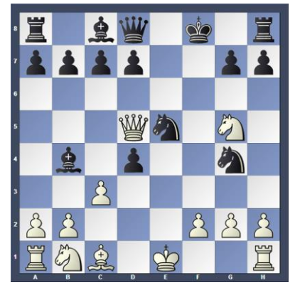
Wit aan zet, speel de beste zet (Stap 3)