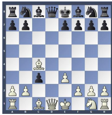
Wit aan zet, speel de beste zet (Stap 2)